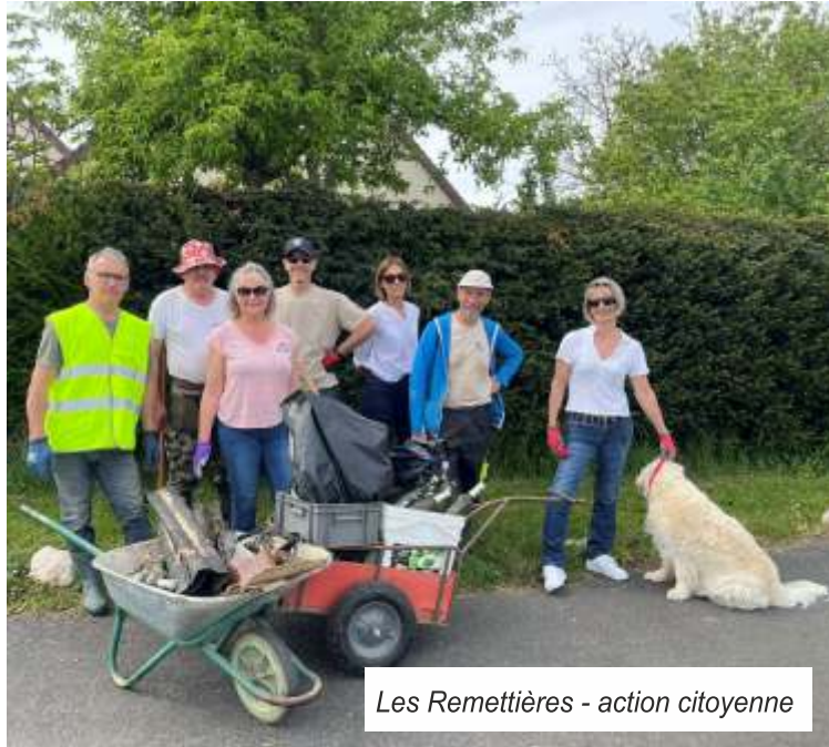
Les Remettières - action citoyenne