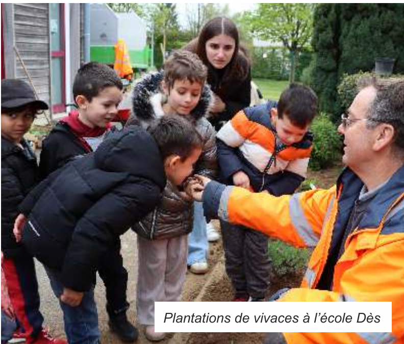
Plantations de vivaces à l'école Dès