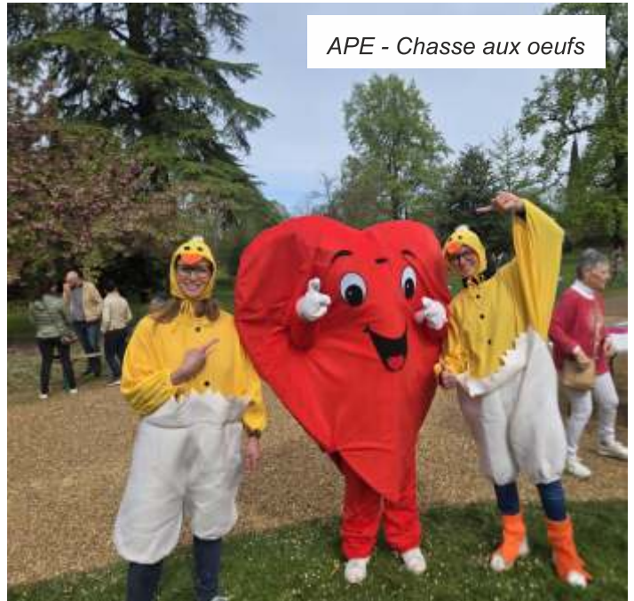
APE - Chasse aux oeufs