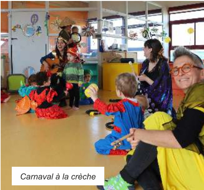
Carnaval à la crèche