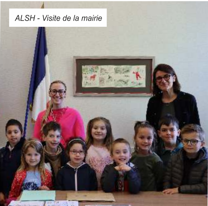
ALSH - Visite de la mairie