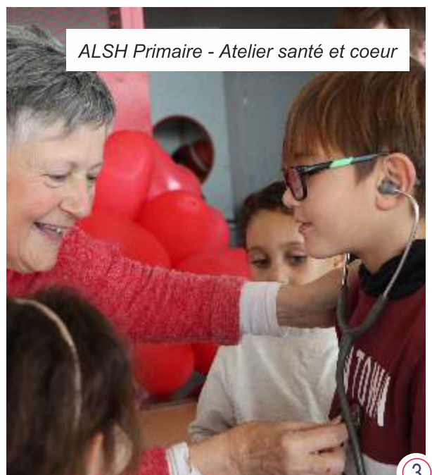
ALSH Primaire - Atelier santé et coeur