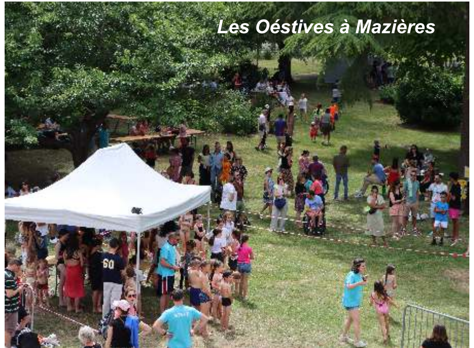
Les Oéstives à Mazières