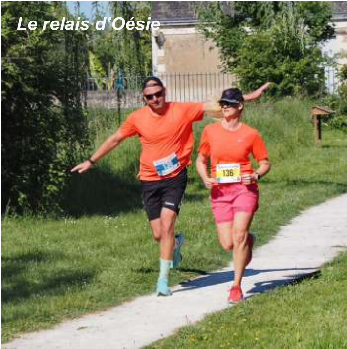
Le relais d'Oésie