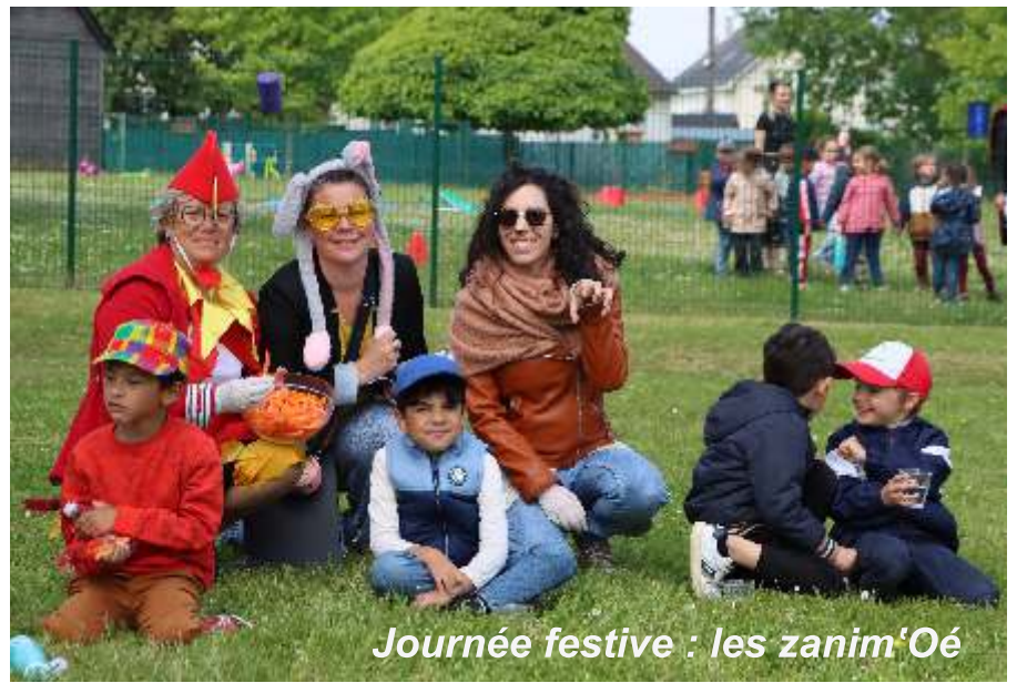
Journée festive : les zanim'Oé