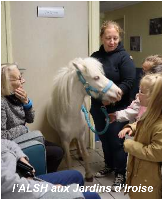
l'ALSH aux Jardins d'Iroise