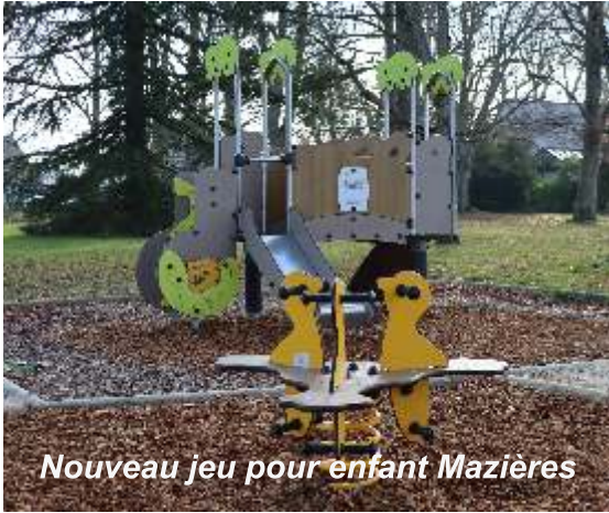
Nouveau jeu pour enfant Mazières