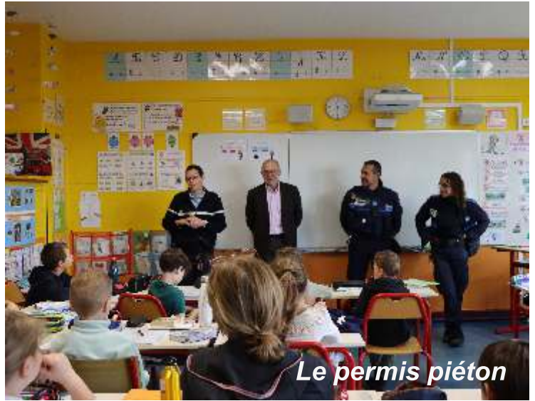
Le permis piéton