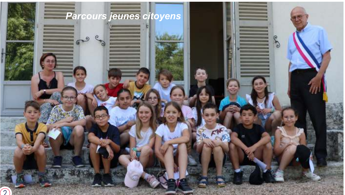
Parcours jeunes citoyens