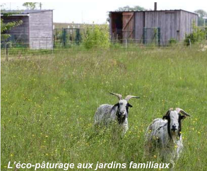
L'éco-pâturage aux jardins familiaux