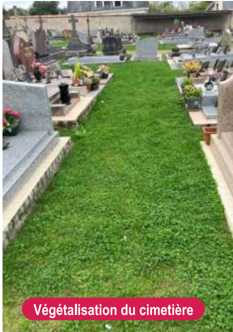
Végétalisation du cimetière