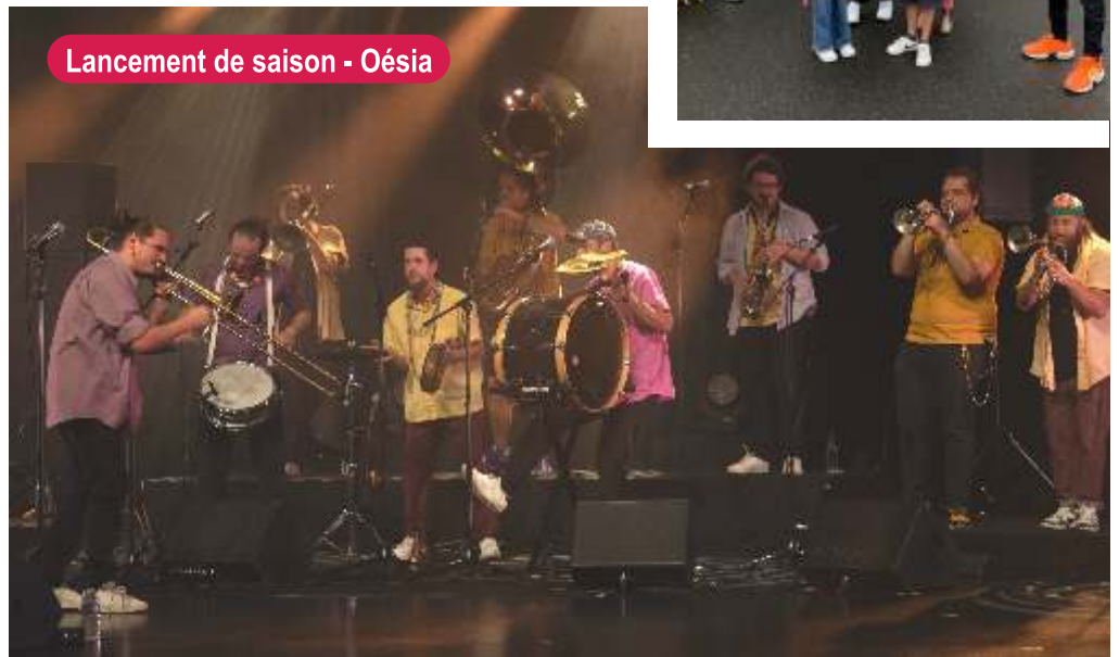
Lancement de saison - Oésie