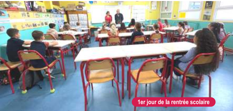
1er jour de la rentrée scolaire