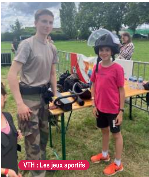
VTH : Les jeux sportifs