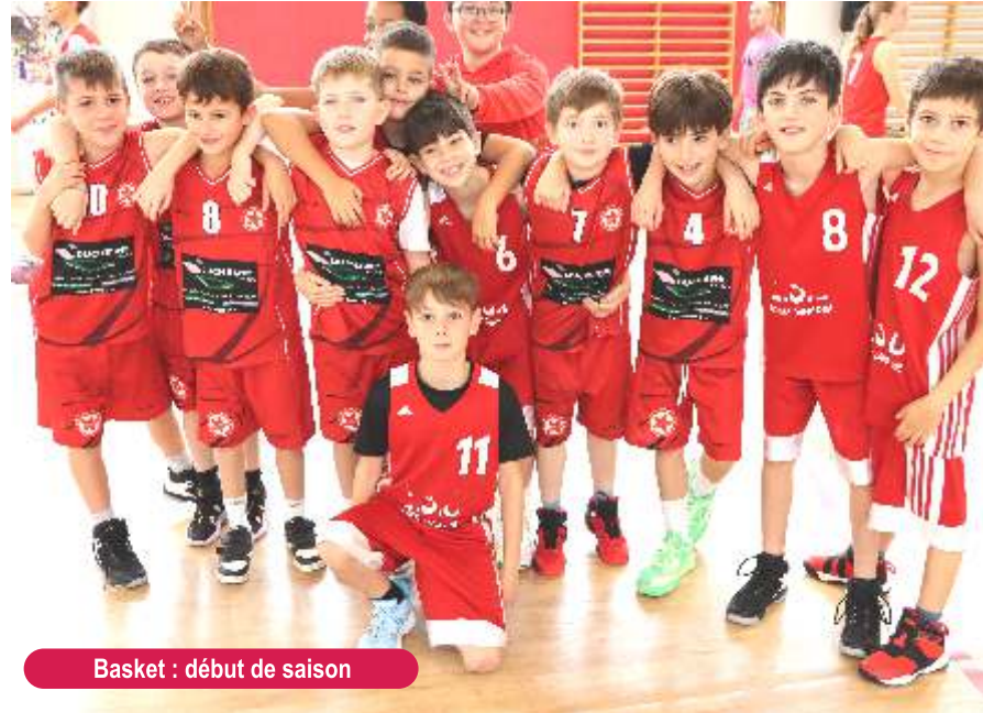
Basket : début de saison