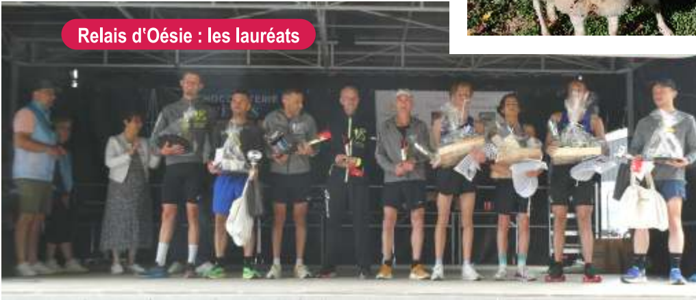
Relais d'Oésie : les lauréats