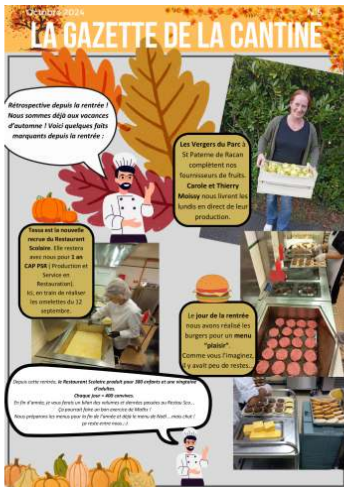
La gazette de la cantine scolaire

Le prix est librement fixé par les collectivités. À Notre Dame d'Oé le montant facturé tient compte du coût de revient de la confection du repas et comprend également l'encadrement des enfants sur le temps de restauration. Le reste à charge des familles représente environ 50% du prix de revient soit 3.88 € pour les maternelles et 4.43 € pour les primaires.