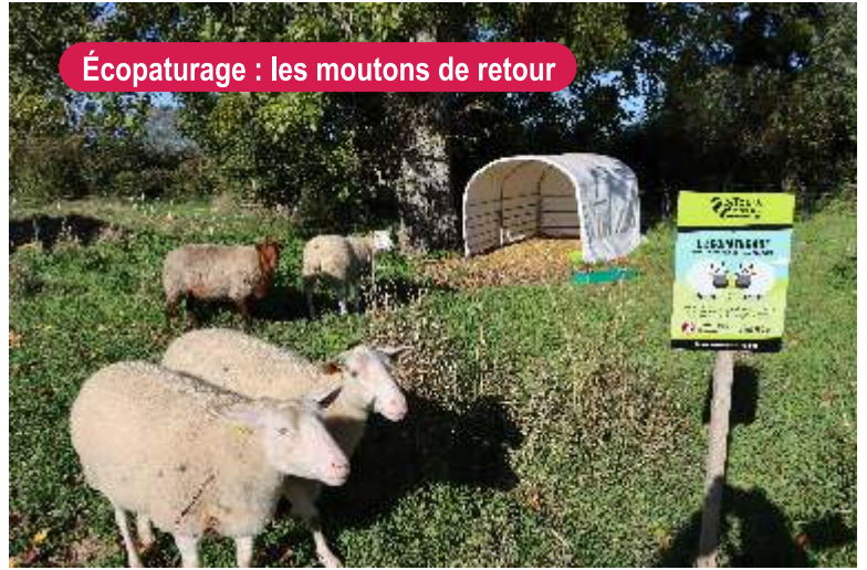
Écopaturage : les moutons de retour