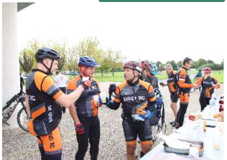
À l'arrivée, bernache et merguez ont récompensé les efforts fournis.

Chacun choisit donc son parcours avec le vélo de son choix : VTT musculaire ou à assistance électrique. Si le soleil était de la partie au départ, il faut un peu d'agilité pour tenir en selle et passer les sections les plus boueuses par l'accumulation des pluies de la semaine écoulée.