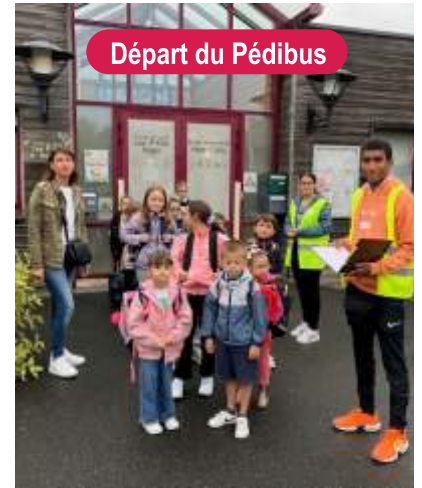
Départ du Pédibus