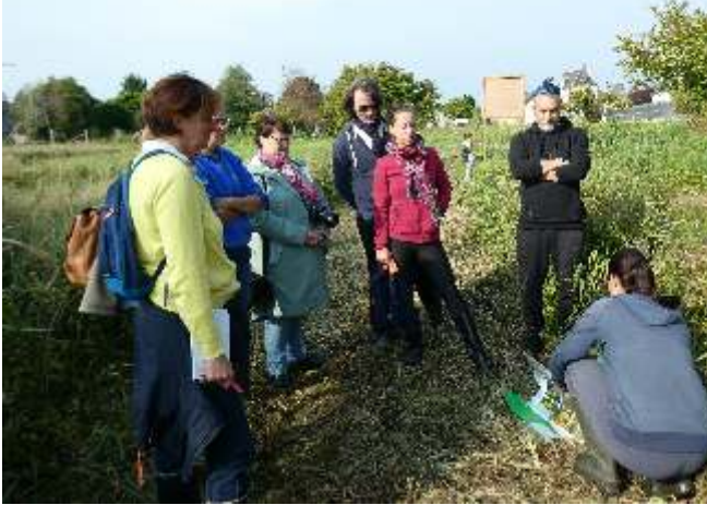
Zone humide : visite avec la SEPANT