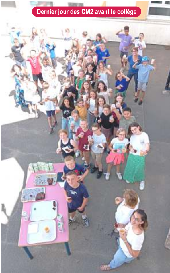
Dernier jour des CM2 avant le collège