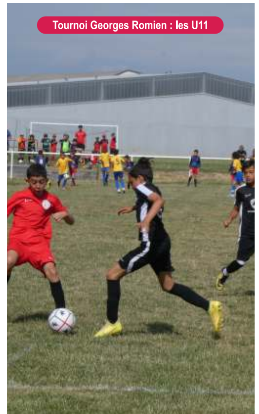
Tournoi Georges Romien : les U11