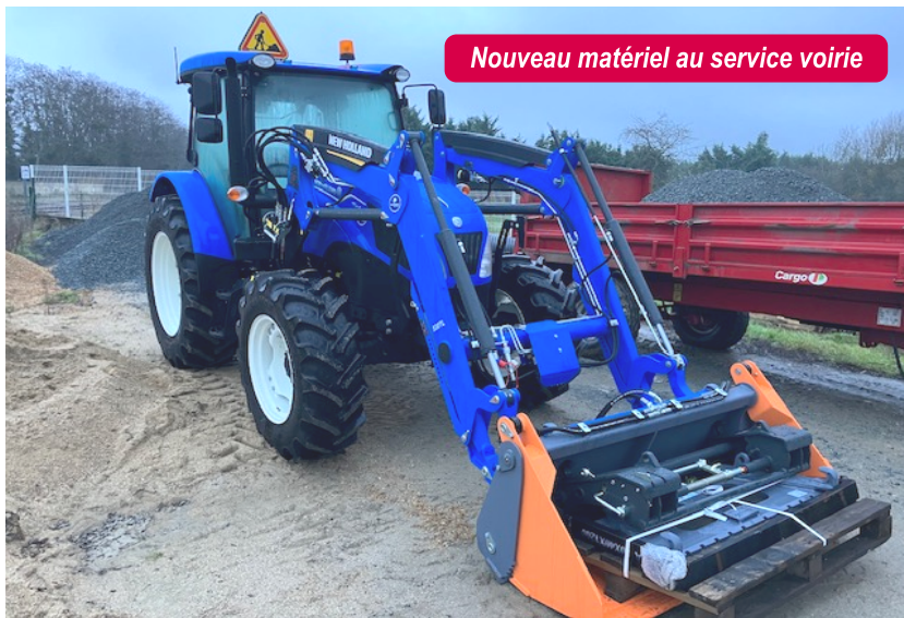
Nouveau matériel au service voirie