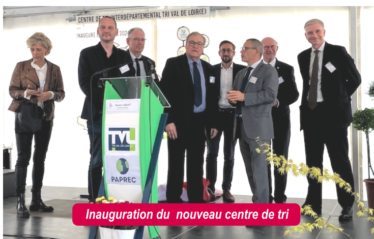
Inauguration du nouveau centre de tri