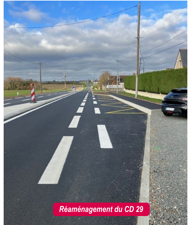
Réaménagement du CD 29