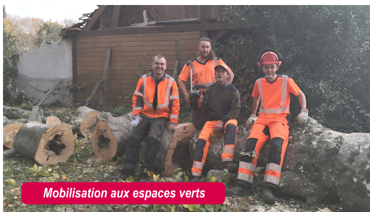
Mobilisation aux espaces verts