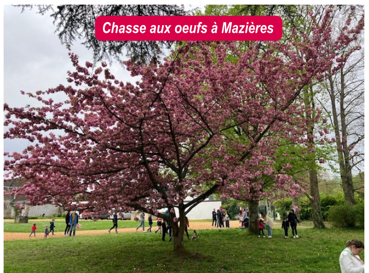
Chasse aux oeufs à Mazières