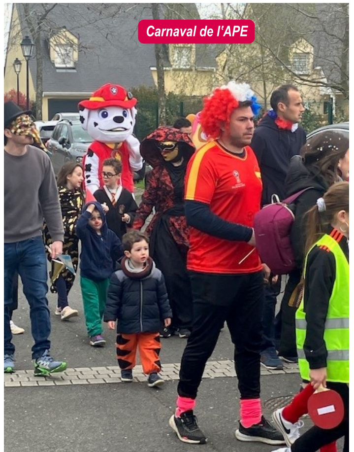
Carnaval de l'APE