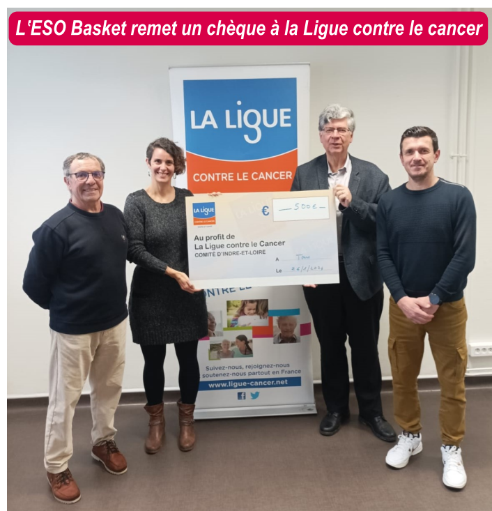
L'ESO Basket remet un chèque à la Ligue contre le cancer