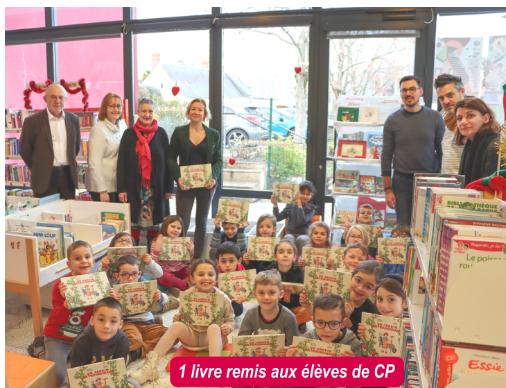
1 livre remis aux élèves de CP