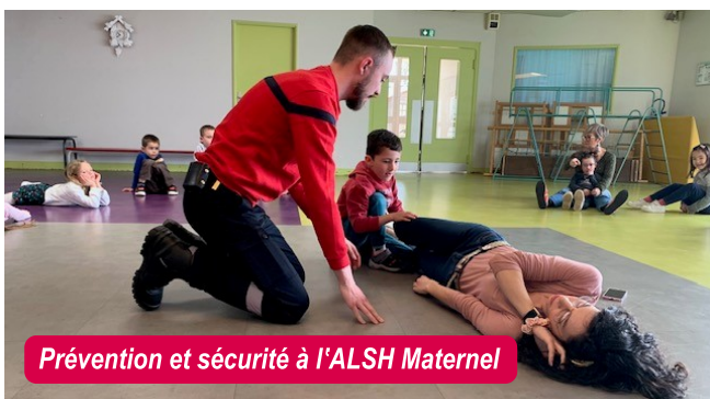
Prévention et sécurité à l'ALSH Maternel