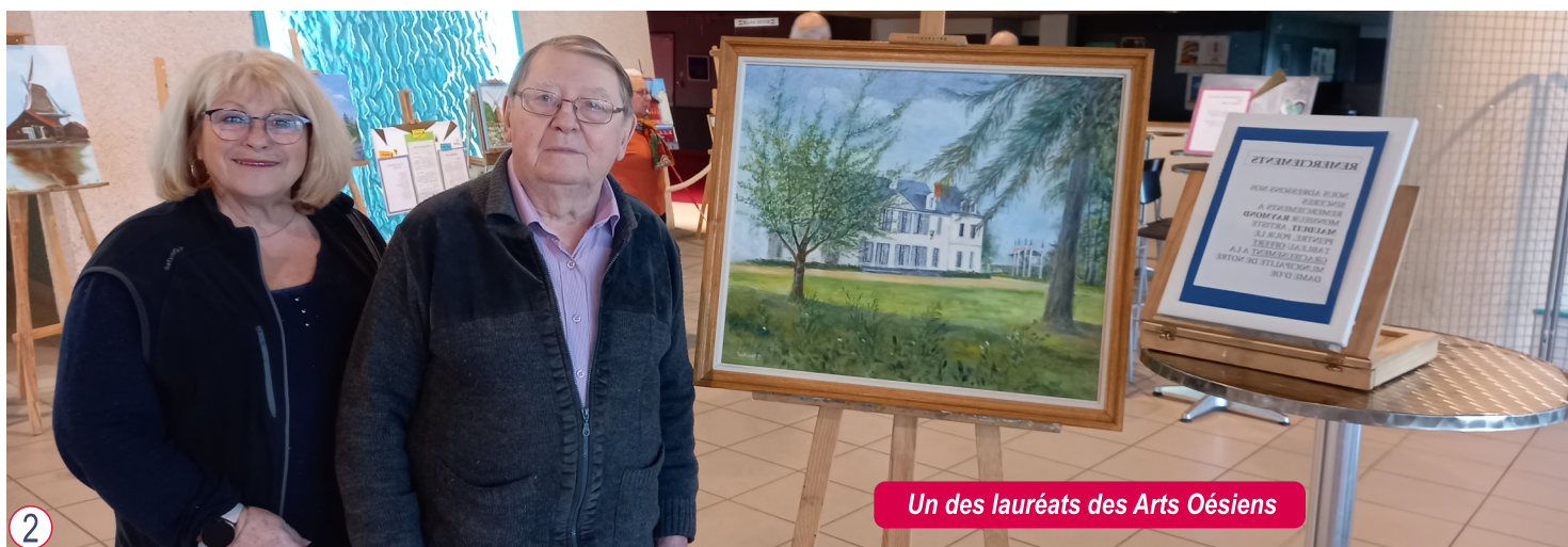
Un des lauréats des Arts Oésiens