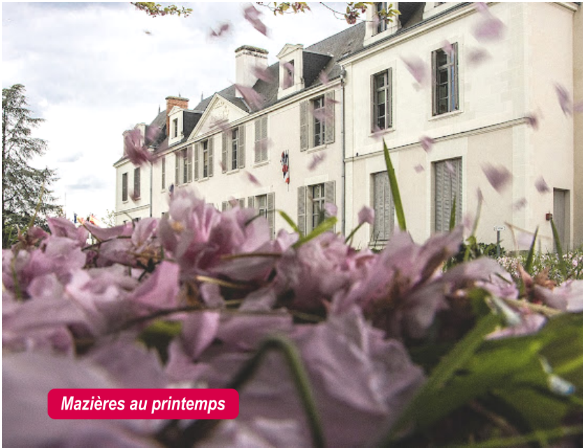
Mazières au printemps