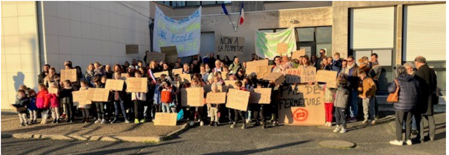
La mobilisation des élèves, des parents et des élus pour dire NON à la fermeture de la 11ème classe.

Fin décembre 2023, la municipalité reçoit une demande d'échange de la part de l'Inspectrice de l'Education Nationale concernant la carte scolaire de la prochaine rentrée 2024 - 2025.