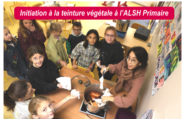
Initiation à la teinture végétale à l'ALSH Primaire