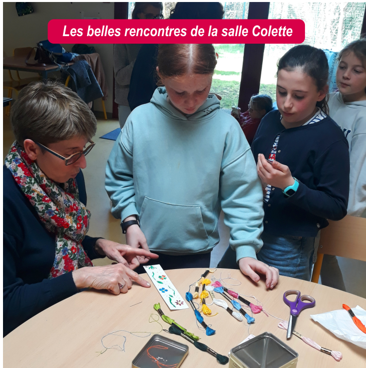
Les belles rencontres de la salle Colette