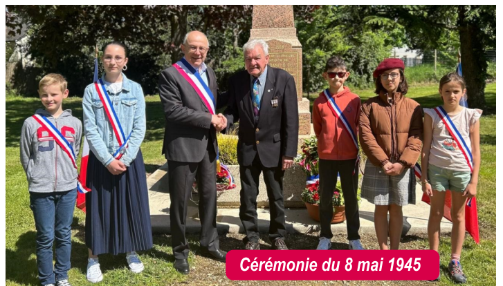
Cérémonie du 8 mai 1945