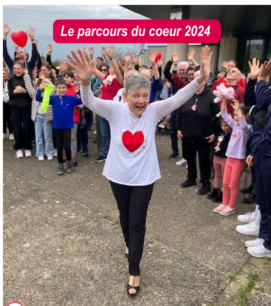
Le parcours du coeur 2024