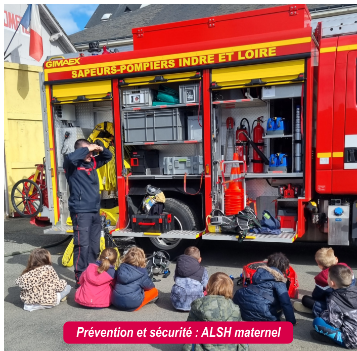
Prévention et sécurité : ALSH maternel