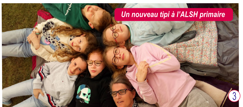
Un nouveau tipi à l'ALSH primaire