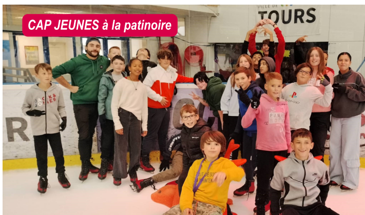
CAP JEUNES à la patinoire