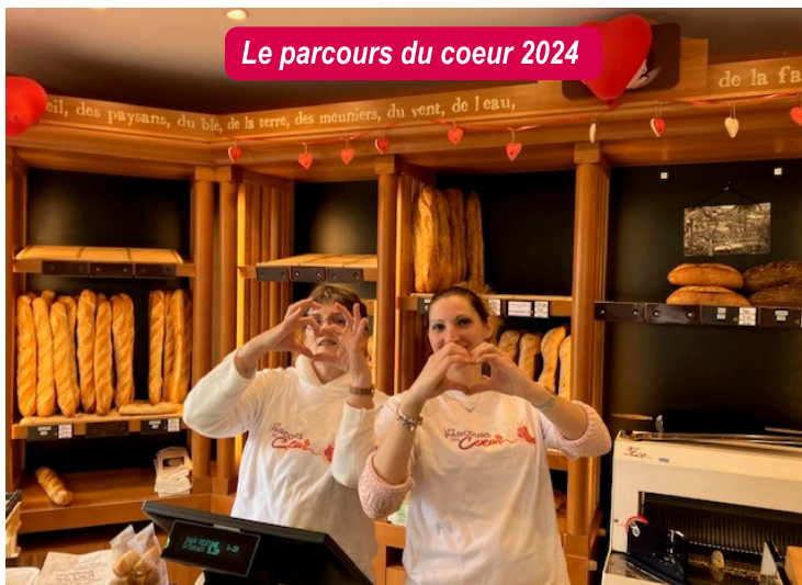
Le parcours du coeur 2024