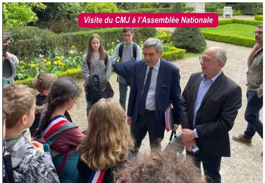
Visite du CMJ à l'Assemblée Nationale